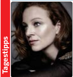
Die Violinstin Carolin Widmann ist Solistin des Abends