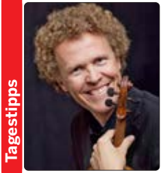
Die musikalische Leitung hatte Gottfried von der Goltz am Pult des Konzerthauses Freiburg

Instrumentalmusik MITSCHNITT Mit virtuoser Instrumentalmusik von Bach und Vivaldi hat das Freiburger Barockorchester am 28.11.2024 zum klangvollen Streifzug durch sein Kernrepertoire eingeladen.