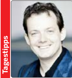
Der Lette Andris Nelsons ist seit 2018 Gewandhauskapellmeister des Leipziger Gewandhausorchesters