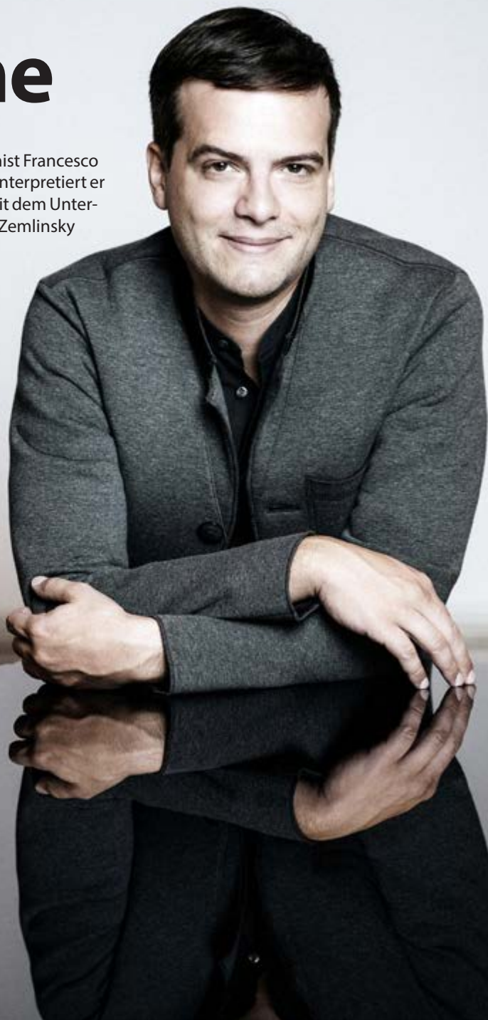
SÜD FOTO: MARCO BORGREVE