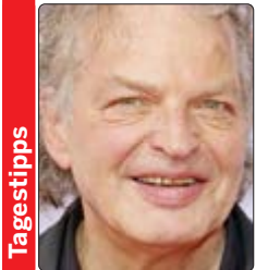
Die deutsche Klavierlegende Joachim Kühn trat mit seiner Band im November auf dem Jazzfest Berlin 2024 auf