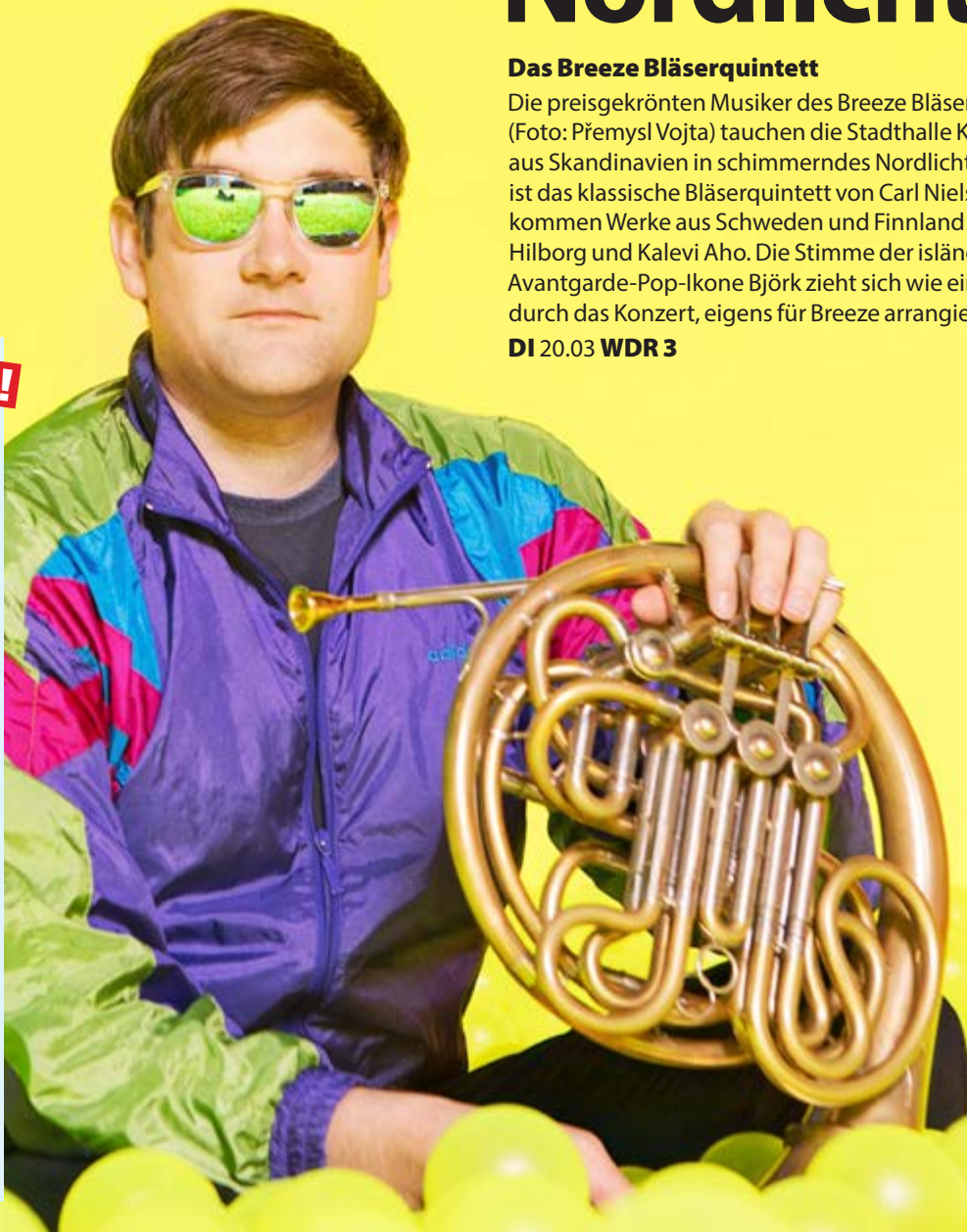
WEST FOTO: JOELLE VAN AUTREVE