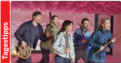
Für die Klangfarben nordischer Komponisten spielt das Bläserquintett Breeze die ideale Klangpalette