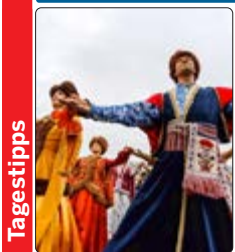
Die Polonaise wurde Ende 2023 in die UNESCO-Liste immaterieller Weltkulturgüter eingetragen