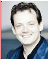
Der Lette Andris Nelsons ist seit 2018 Gewandhauskapellmeister des Leipziger Gewandhausorchesters