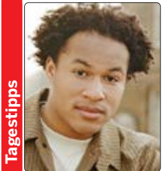
Sheku Kanneh-Mason (Foto) spielte Elgars Cellokonzert