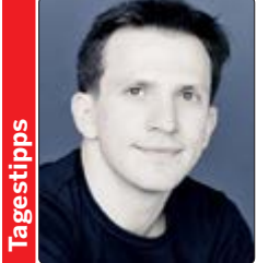
Cornelius Meister steht am Pult des hr-Sinfonieorchesters