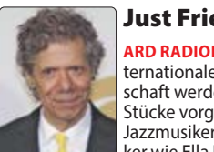
Just Friends ARD RADIOFESTIVAL Am Internationalen Tag der Freundschaft werden Songs und Stücke vorgestellt, in denen Jazzmusikerinnen und -musiker wie Ella Fitzgerald, Chick Corea (Foto) und Brad Mehdau Freundschaften zum Thema machen. 60 Min.