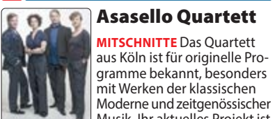
MITSCHNITTE Das Quartett aus Köln ist für originelle Programme bekannt, besonders mit Werken der klassischen Moderne und zeitgenössischer Musik. Ihr aktuelles Projekt ist die Gesamtaufnahme der 15 Streichquartette von Schostakowitsch (von 2022/23). 105 Min.