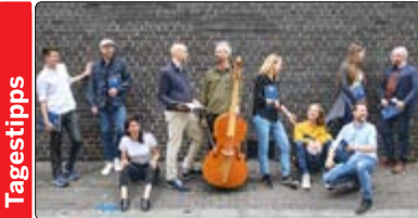
Das Vokal- und Instrumentalensemble Solomons' Knot wurde 2008 in London gegründet