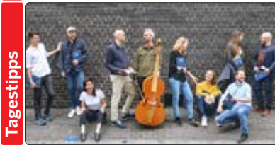
Das Vokal- und Instrumentalensemble Solomon's Knot wurde 2008 in London gegründet