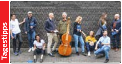
Das Vokal- und Instrumentalensemble Solomons Knot wurde 2008 in London gegründet