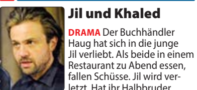
Khaled auf sie geschossen? – Von Joy Markert, mit Michael Rotschopf (Foto). 57 Min.