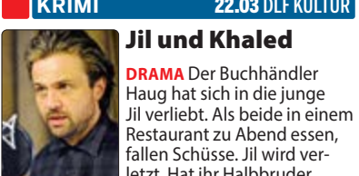
Jil und Khaled Khaled auf sie geschossen? – Von Joy Markert, mit Michael Rotschopf (Foto). 57 Min.