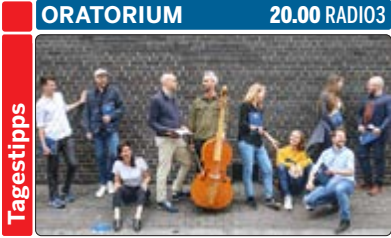
Das Vokal- und Instrumentalensemble Solomon's Knot wurde 2008 in London gegründet