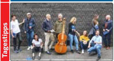
Das Vokal- und Instrumentalensemble Solomon's Knot wurde 2008 in London gegründet