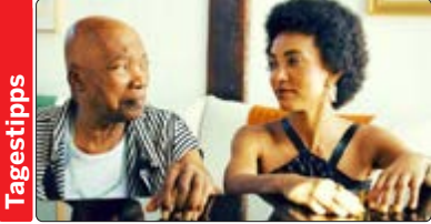
Milton Nascimento und Esperanza Spalding brachten das Album „Milton + esperanza“ heraus