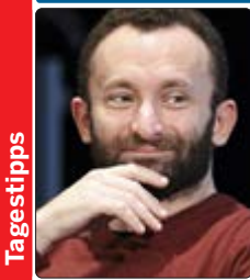
Der russische Dirigent Kirill Petrenko steht am Pult der Berliner Philharmoniker