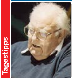
Hans Paetsch liest „Erinnerungen an Stendhal“