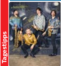
Das Signum saxophone quartet war Preisträger in Residence bei den Festspielen Mecklenburg-Vorpommern 2024