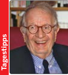
Der Altgermanist Peter Wapnewski (1922–2012) ist in dieser Produktion von 1997 zu hören