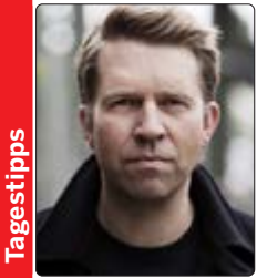
Mit Leif Ove Andsnes (Foto) und Bertrand Chamayou hat das diesjährige Klavier-Festival Ruhr gleich zwei namhafte Pianisten auf die Bühne geholt