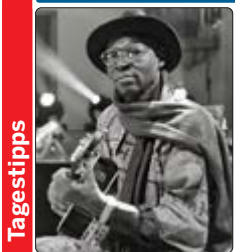
Ali Farka Touré (1939–2006) hat mit seiner einzigartigen Mischung aus Tradition und Innovation einen bleibenden Eindruck hinterlassen

„ZEITZEICHEN“ Der „Bluesman of Africa“ (auch „König des Wüsten-Blues“) galt als einer der renommiertesten Musiker Afrikas. Das Rolling Stone Magazin kürte ihn zu einem der einhundert besten Gitarristen aller Zeiten. Er kombinierte traditionelle malische Musik, insbesondere den Bambara- und Songhai-Stil, mit Elementen des Blues. Zu seinen bekanntesten Alben gehören „Ali Farka Touré“ (1987) und „Talking Timbuktu“ (1994). 15 Min.