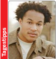
Der gefeierte britische Cellist Sheku Kanneh-Mason gastierte in der Kölner Philharmonie