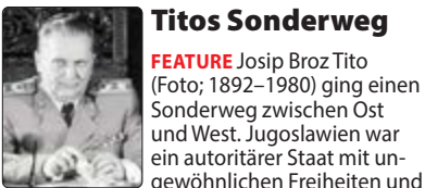
Bewunderern in aller Welt. Am Ende versank es in einen blutigen Bürgerkrieg. 30 Min.