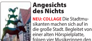
Spuren der Tiere und überschreiben das Märchen mit ihren eigenen Biografien. 57 Min.