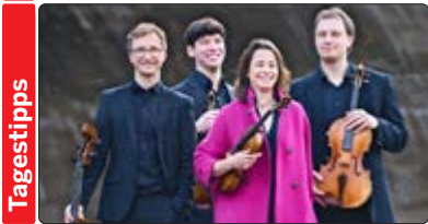
Das Eliot Quartett, 2014 gegründet, gehört zu den erfolgreichsten jüngeren Streichquartetten