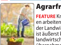
Agrarfrauen Knapp 350 000 Frauen arbeiten in Deutschland in der Landwirtschaft. Ihre Rolle ist äußerst komplex: Neben landwirtschaftlicher Arbeit übernehmen sie Kindererziehung, Büroarbeit und Verpflegung von Familie und Mitarbeitern. 30 Min.