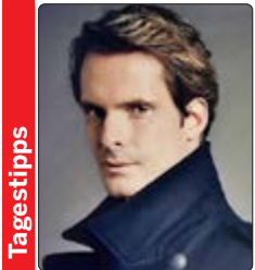
Der französische Harfenist Xavier de Maistre spielte im August 2024 in der Kappeller St. Nikolai-Kirche