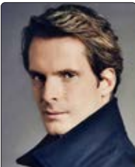
Der französische Harfenist Xavier de Maistre spielte im August 2024 in der Kappelner St. Nikolai-Kirche