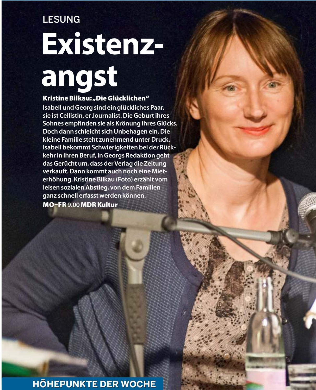
OST FOTO: IMAGO / VIADATA