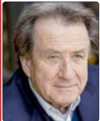
Rudolf Buchbinder setzt pianistische Maßstäbe seit über 60 Jahren