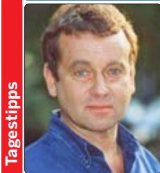
Der Schauspieler Edwin Noel (1944–2004) ist in der Rolle des jungen Cooper zu hören