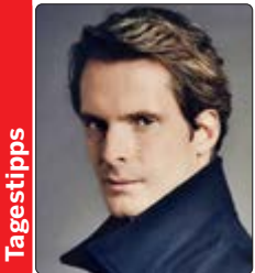
Der französische Harfeinist Xavier de Maistre spielte im August 2024 in der Kappelner St. Nikolai-Kirche