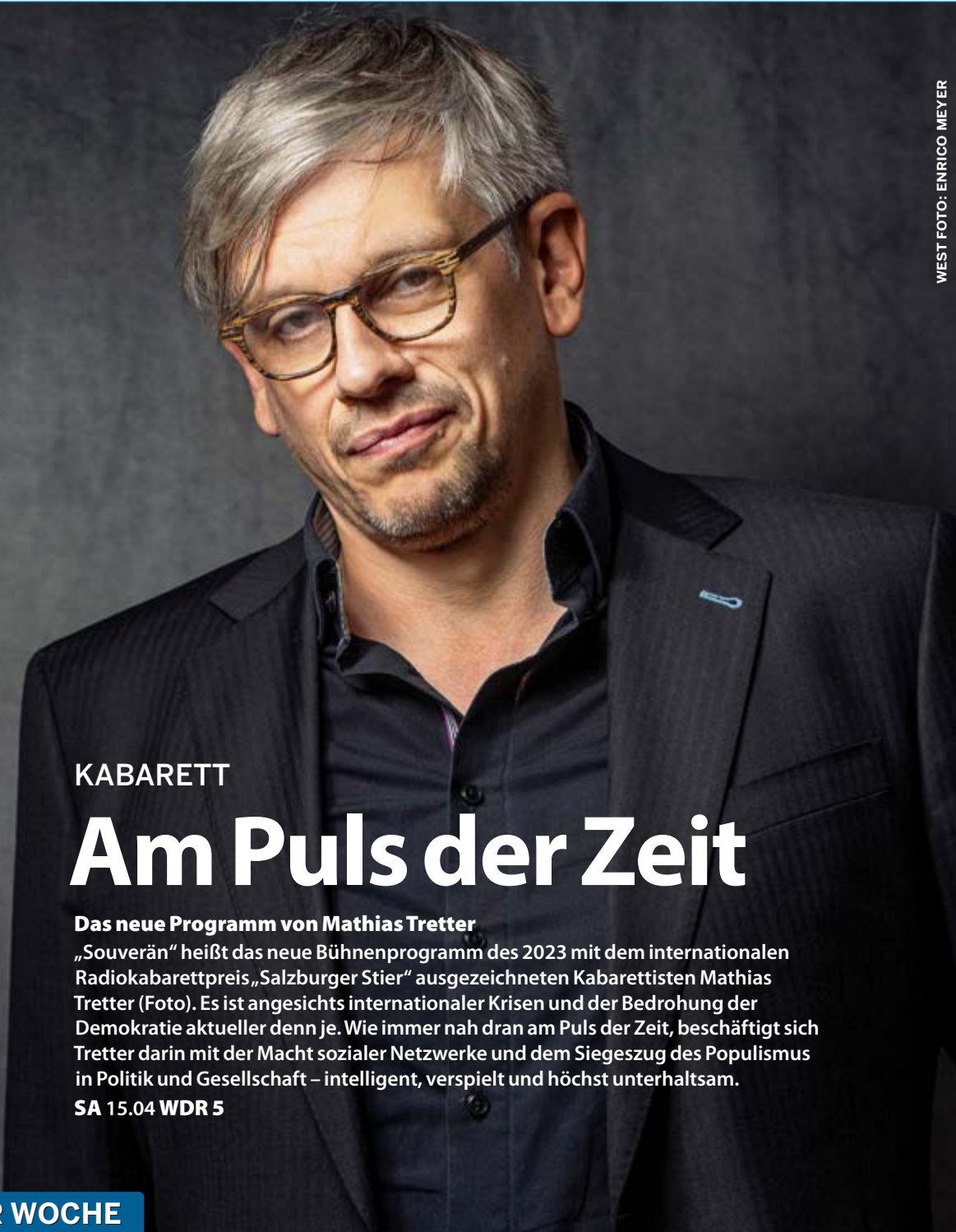
WEST FOTO: ENRICO MEYER

Auf Plattformen wie Spotify, Apple Podcasts u.a.