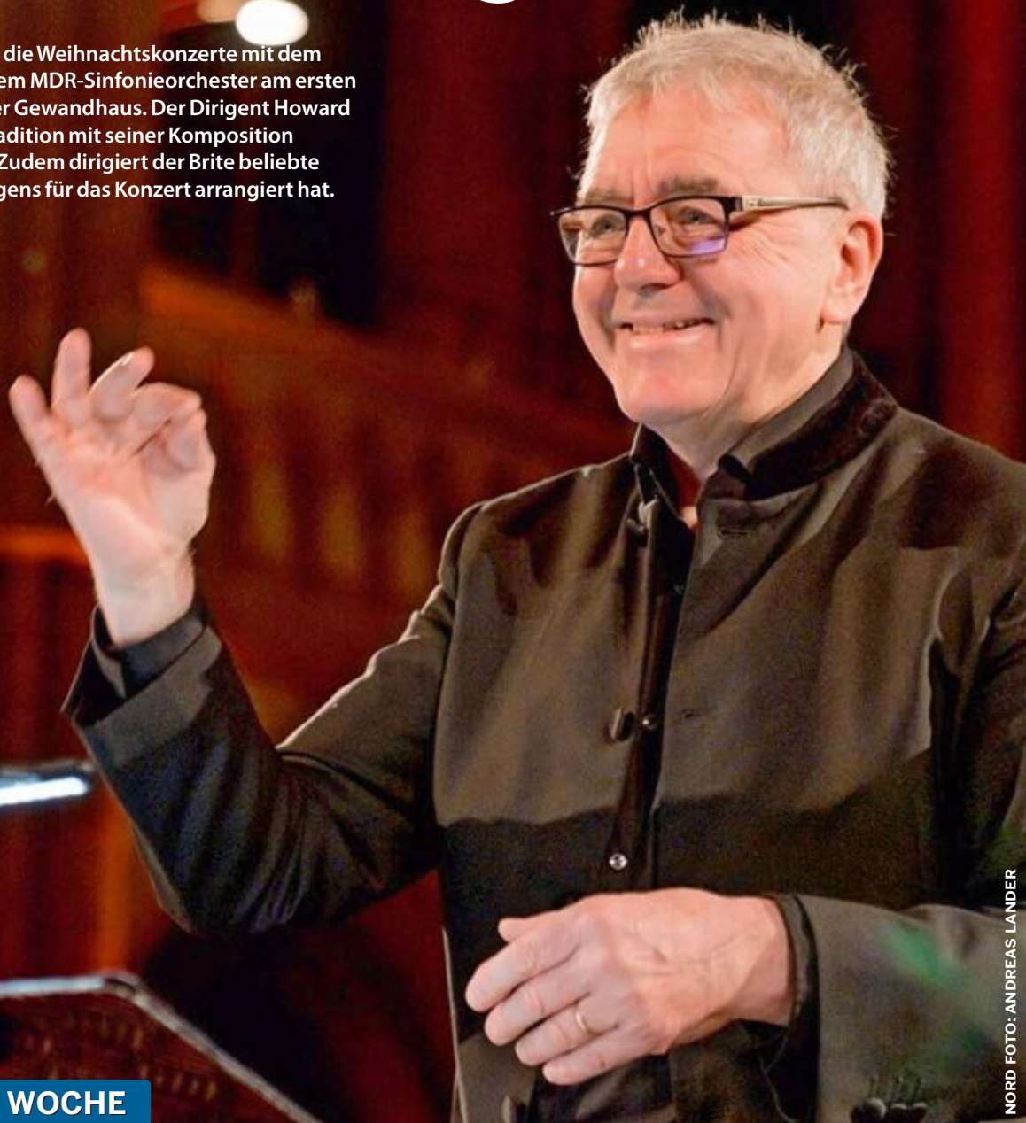
NORD FOTO: ANDREAS LANDER