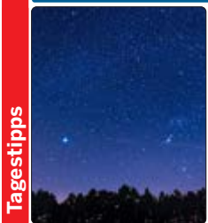
Seit Urzeiten deuten die Menschen die Sterne auch spirituell