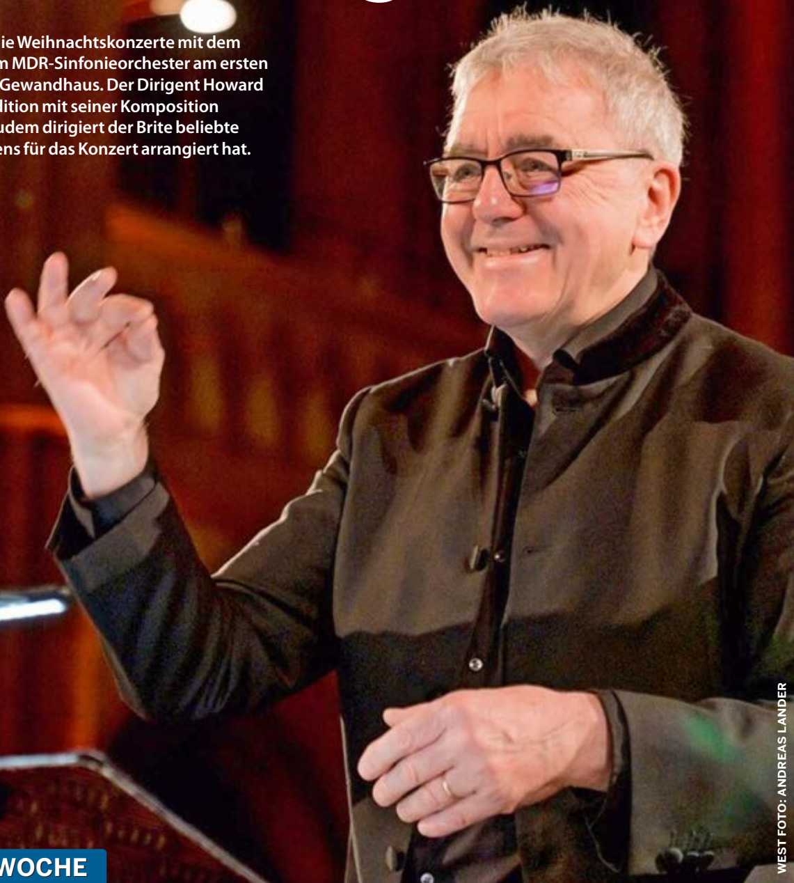
WEST FOTO: ANDREAS LANDER