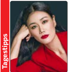
Jihye Lees neue Kompositionen bestechen durch ihre Klangvielfalt und rhythmische Finesse