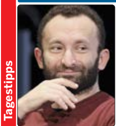
Kirill Petrenko dirigiert in der Berliner Philharmonie das letzte Konzert des Jahres