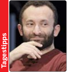
Kirill Petrenko dirigiert in der Berliner Philharmonie das letzte Konzert des Jahres