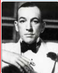
Am 16. Dezember jährte sich Noël Cowards Geburtstag zum 125. Mal