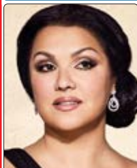
Die Sopranistin Anna Netrebko interpretierte die Rolle der Donna Leonora de Vargas