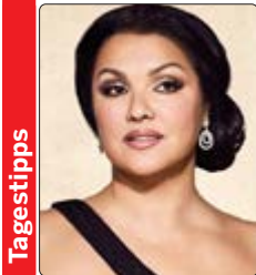
Die Sopranistin Anna Netrebko interpretierte die Rolle der Donna Leonora de Vargas