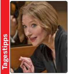
Die Musikerin ist für ihre Kombination aus glühender Leidenschaft und handwerklicher Präzision bekannt