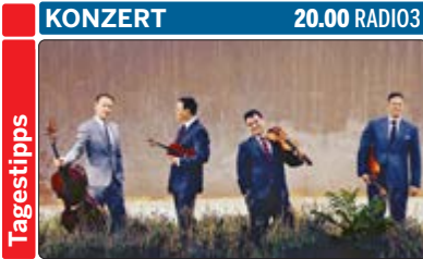
Das Jerusalem Quartet spielte in Bad Tölz ein Konzert zum 50. Todesjahr von Dmitri Schostakowitsch