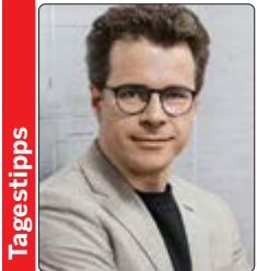
Jakub Hrůša (Foto) dirigierte Werke von Beethoven und Martinů