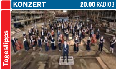
Das 1979 gegründete Kyiv Symphony Orchestra ist das sinfonische Aushängeschild der Ukraine