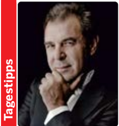
Der italienische Dirigent Daniele Gatti stand am Pult der Sächsischen Staatskapelle Dresden